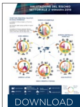
Infografica sul rischio settoriale - 2° trimestre 2019

L'analisi di Coface sul comportamento di pagamento delle imprese in Asia ha preso in esame oltre 3.000 imprese di nove economie (Australia, Cina, Hong Kong, India, Giappone, Malesia, Singapore, Thailandia e Taiwan). Il 63% delle imprese intervistate ha dichiarato ritardi di pagamento nel 2018 con una durata media di 88 giorni.