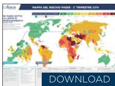
Mappa del rischio paese - 2° trimestre 2019