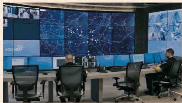
Postazione videowall per le videoanalisi - Centrale Operativa