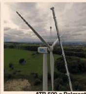
ATB 500 a Poimont

che ospita anche la sede legale della Società. Sono molteplici i segreti di tanto successo. Alla base vi è senza dubbio la politica gestionale che caratterizza da sempre la Viba. In azienda vige un'armonia e un'unità di intenti e vedute tra titolari e maestranze che si riflette positivamente sull'efficienza produttiva. E la stessa alta qualità dei rapporti si conferma tanto con i clienti quanto con i fornitori. Serietà, correttezza e rispetto degli impegni assunti sono punti imprescindibili nella filosofia di lavoro di questa realtà aziendale bresciana. Ma tutto ciò non basterebbe se non fosse accompagnato da un'attenta e moderna gestione delle attività produttive. Parallelemente ad un'oculata politica di contenimento dei costi, il management di Viba non ha mai risparmiato su tutti quei necessari investimenti in grado di migliorare di anno in anno gli standard produttivi e oggi — ma in realtà già da tempo — pone grande attenzione all'innovazione tecnologica, dove sono state investite ingenti risorse che le hanno consentito di crescere e di giungere al venticinquesimo compleanno posizionata a pieno titolo nel novero delle industrie italiane 4.0. ■