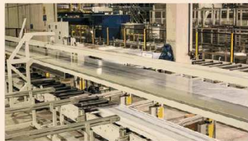
Linea di estrusione