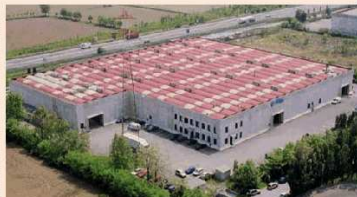
Unità produttiva di Brescia